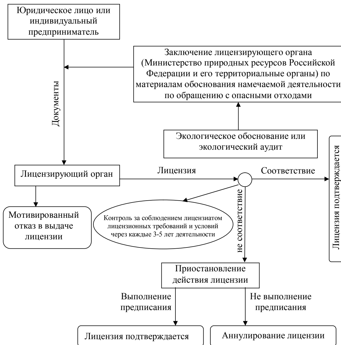
Рис. 1. Обобщённая схема процесса получения лицензии и её подтверждения

Всё вышесказанное можно представить в виде схемы, представленной на рис. 1.