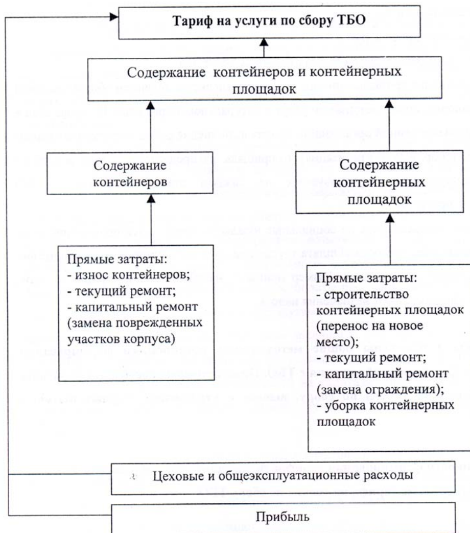
Рис. 4.1. Структура тарифа на услуги по сбору ТБО в домовладениях.

Структура тарифа на услуги по сбору ТБО представлена на рис. 4.1.